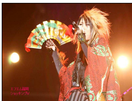
圖四：主唱拿著舞扇歌唱並揮動舞扇