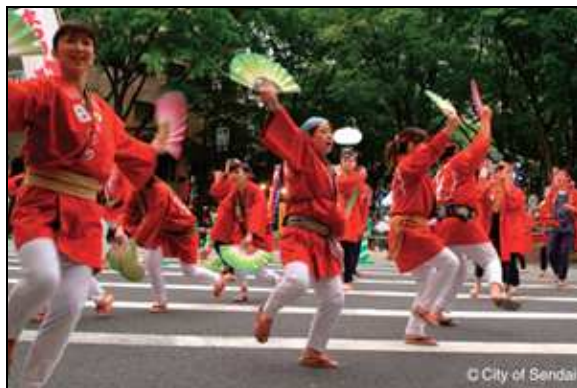
圖三：在祭典上拿著扇子跳舞