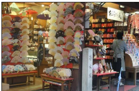
圖一：在京都有許多賣扇子的店家