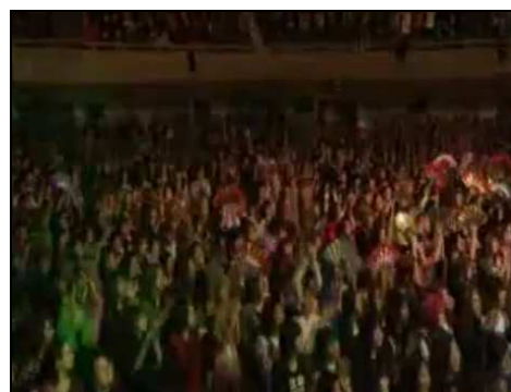
圖五：台下粉絲拿著舞扇跟著揮動