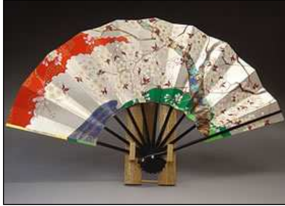
圖二：用來室內裝飾的裝飾扇